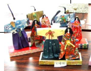
季節の工作：お雛さま