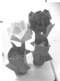
軽体操と 季節の工作