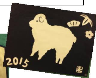
季節の工作：干支飾り