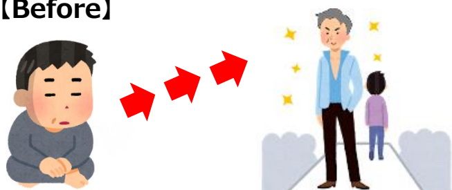
注：画像はイメージです